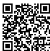
لوکیشن دفتر مرکزی